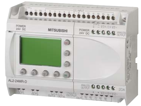
Контроллер серии ALPHA2 (производство MITSUBISHI ELECTRIC)